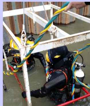
Nacelle de mise à l'eau pour 2 scaphandriers.

Toutes ces opérations sont effectuées sous une hauteur d'eau comprise entre 8 et 14m, c'est pourquoi notre caisson de recompression est disponible sur site, durant la période des travaux.