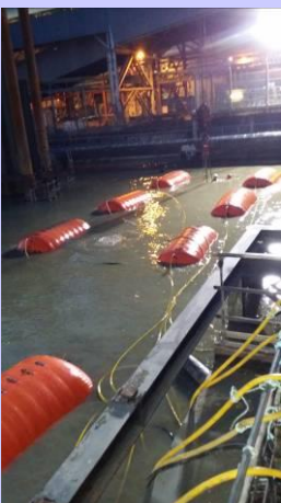
Renflouement de l'ancienne structure par parachutes.

Quelques unes de ces tâches délicates sont détaillées ci-dessous :