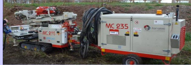
Foreuse COMACCHIO MC235