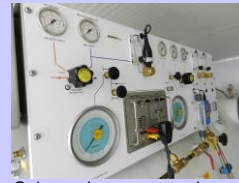
Caisson de recompression