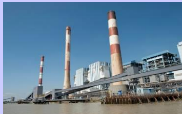
Unité production thermique de Cordemais.

Il s'agit pour nous, de se mettre à disposition pour des interventions spécifiques, nécessitant une ou plusieurs équipes, pour l'assistance aux travaux de fondations des ouvrages en construction.